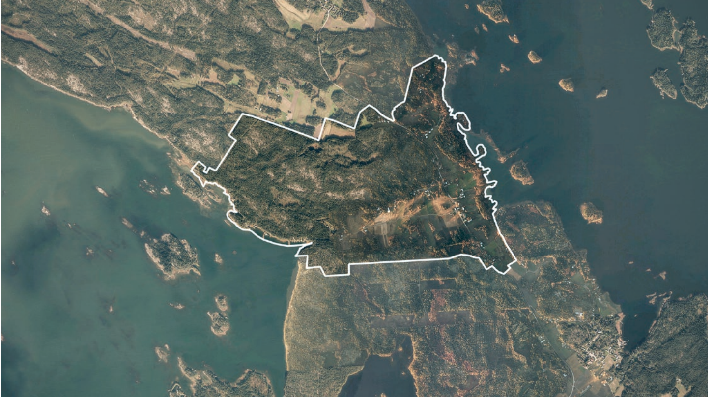
Ilmakuva Pyhämaasta. Suunnittelualue rajattuna kuvassa.