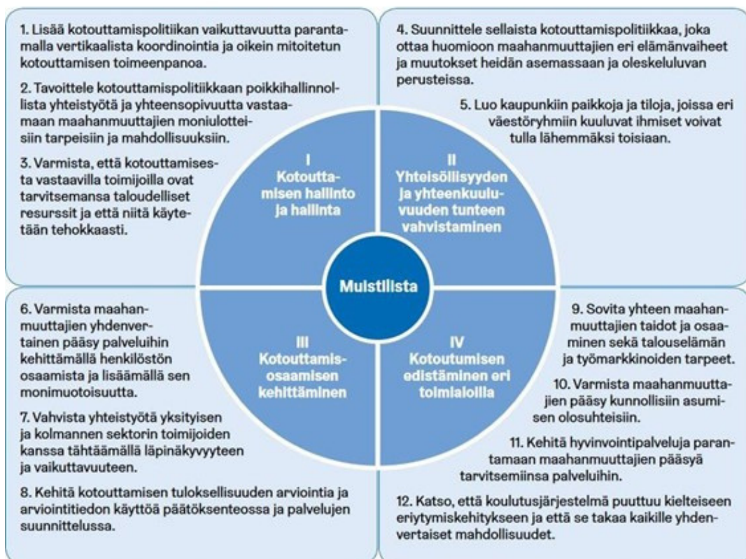
Kuvio 1. Kotouttamisen muistilista paikallistason toimijoille

Uudenkaupungin kotoutumisen toimenpideohjelman 2021–2023 työryhmä loi kotouttamisen muistilistan paikallistason toimijoille. Työryhmä haki kattavasti kehittämisen kohteita ja huomioon otettavia asioita laatiessaan aiempaa toimenpideohjelman. Muistilista on edelleen ajankohtainen, ja se on päätetty sisällyttää myös Uudenkaupungin kotouttamisohjelmaan vuosille 2023–2025. Puhuttaessa Uudenkaupungin maahanmuuttajista ryhmään sisältyy henkilöitä, jotka eroavat hyvin paljon toisistaan ja toisaalta edustavat jokainen yksilönä monimuotoista uusikaupunkilaisuutta. Tavoitteena on, että uudet uusikaupunkilaiset kotoutuisivat hyvin kaupunkiimme ja kokisivat osallisuutta yhteisössä.