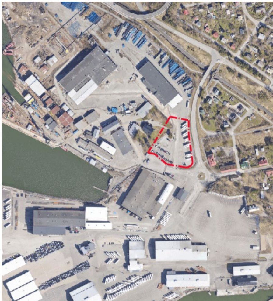
Suunnittelualue ilmakuvalla 2023