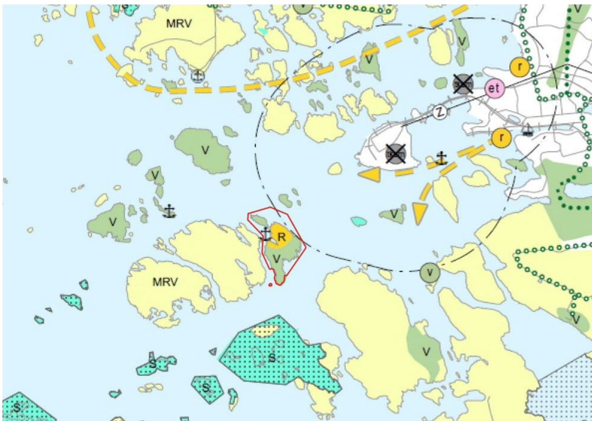
Ote Varsinais-Suomen luonnonarvojen ja -varojen vaihemaakuntakaava