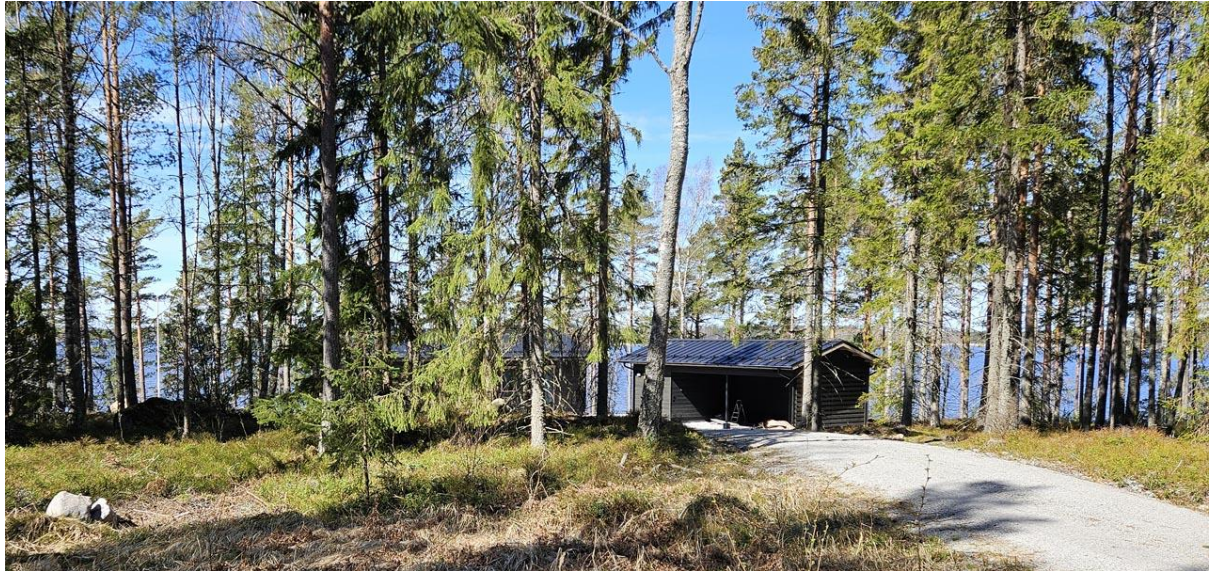
Kuva 1: Ranta laskeutuu melko jyrkästi makeavesialtaaseen, eikä esim. seudulle ja alueen saaristolle tyypillistä rantaviivan tervaleppärantaa ole.