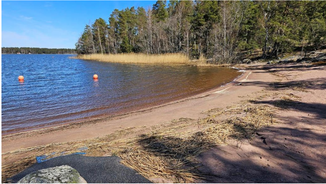
Kuva 2: Haimion uimaranta, jonka takana puiden läpi häämöttää lähimmät rakennukset.